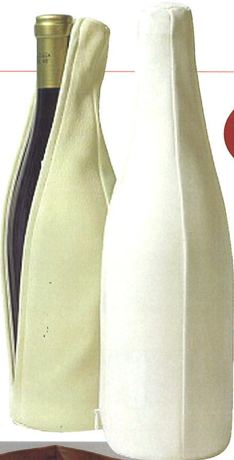
▶綿水加工した革でしなやかにボトルを包む。上質さと新感覚を表現。