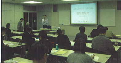
▲デザイナーへのマーケティング情報説明会。

東かがわ市商工会では、「JAPANブランド育成支援事業」として、地域ブランド構築のための商品開発企画、および、優れたデザインの商品を集め、厳しい審査を行っています。そして、審査を通過したものに対して、販売のための全面バックアップを行っています。