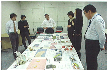
▶たぐさんの商品提案を受け、選定中。

し、マーケティングや商品開発のお手伝いをする」というコンセプトと同じくする、ものづくり研究所は、パートナー企業として参加し、コンペによって選ばれた商品案をデザイナーと東かがわの革加工技術のメーカーと共に新たな商品開発を進めています。「伝統技術の東かがわ」と「もの研」のコラボレーションで作りに上げた商品は、2007年2月28日の「道具の學校」カタログでご紹介する予定です。ものづくりの技と感性を活かした斬新な商品。ぜひ、ご期待ください。