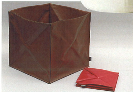
▶折りためる収納ボックス。長く使いこみ、革の風合いを楽しみたい。

し、マーケティングや商品開発のお手伝いをする」というコンセプトと同じくする、ものづくり研究所は、パートナー企業として参加し、コンペによって選ばれた商品案をデザイナーと東かがわの革加工技術のメーカーと共に新たな商品開発を進めています。「伝統技術の東かがわ」と「もの研」のコラボレーションで作りに上げた商品は、2007年2月28日の「道具の學校」カタログでご紹介する予定です。ものづくりの技と感性を活かした斬新な商品。ぜひ、ご期待ください。